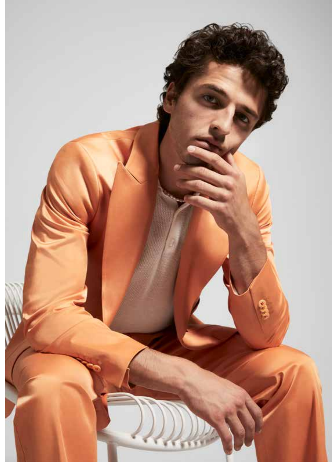
Jacket CIDRAGI 2228-4138-34-241 Polo Shirt CINUP 6007-4503-02-241 Pants CISANTOS 2146-4138-34-241