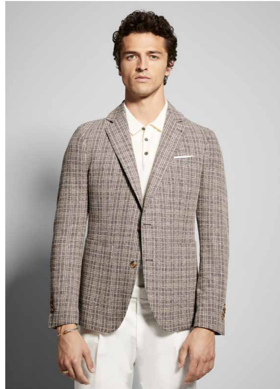
Coat CIJEFFERY 4508-4007-22-241 Jacket CIDATI 2252-4150-23-241 Polo Shirt CIFLAVIO 6036-4513-02-241 Pants CIGIANNI 2124-4130-01-241