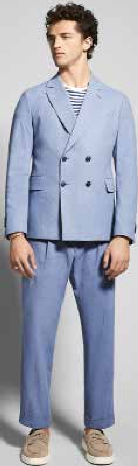
Jacket TWINGO 2229-4142-63-241 T-Shirt CISEBO 7030-7032-64-241 Pants CIGIANNI 2124-4142-63-241